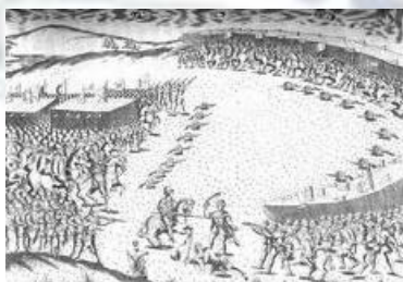
Batalha de Alcácer Quibir

b) Relaciona a imagem com a razão deste acontecimento.